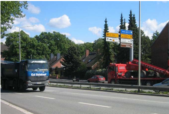
Kiel: B 76 als Bestandteil des Lkw-Bündelungszernetzes

Die Landeshauptstadt Kiel plant die Umsetzung des Lkw-Führungskonzeptes. Zur Vorbereitung soll das Konzept bis zur Umsetzungsreife incl. Wegweisung, verkehrlicher Maßnahmen und kommunikativer Maßnahmen weiterentwickelt werden.