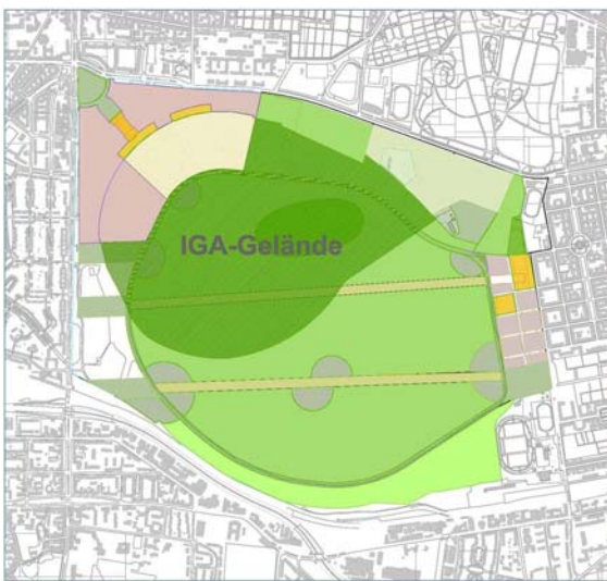
IGA-Gelände auf dem Areal des ehemaligen Flughafens Tempelhof

B erlin bereitet die Durchführung der internationalen Gartenausstellung (IGA) im Jahr 2017 auf dem Areal des ehemaligen Flughafens Tempelhof vor. LK Argus bearbeitete in Zusammenarbeit mit Argus Stadt- und Verkehrsplanung ein Verkehrsgutachten.